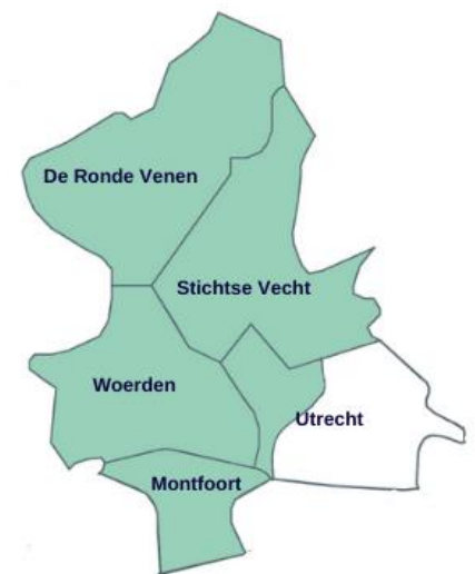
Verzorgingsgebied van RegiozorgNU

De regio Noordwest-Utrecht bestaat uit vijf gemeenten: Utrecht-West (Leidsche Rijn, Vleuten en De Meern), Montfoort, Woerden, Stichtse Vecht en De Ronde Venen (m.u.v. Abcoude).